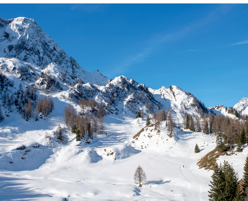
Il sentiero per escursionismo invernale si snoda attraverso il terreno irregolare di Pesciüm.

Bed & Bike Tremola San Gottardo, Airolo, 091 825 60 12, www.tremola-sangottardo.ch