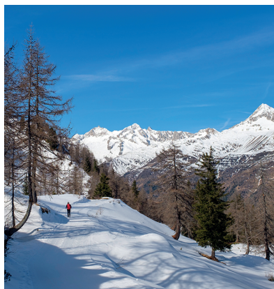
Passeggiata con vista su massiccio del San Gottardo.