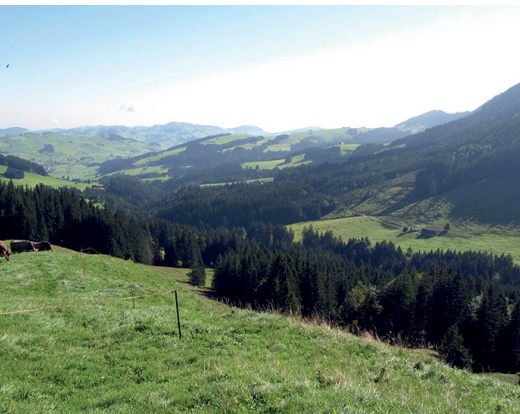
Aussicht von der Alp Blattendürren nach Gonten.

Berggasthaus Kronberg, Tel. 071 794 12 89, www.kronberg.ch