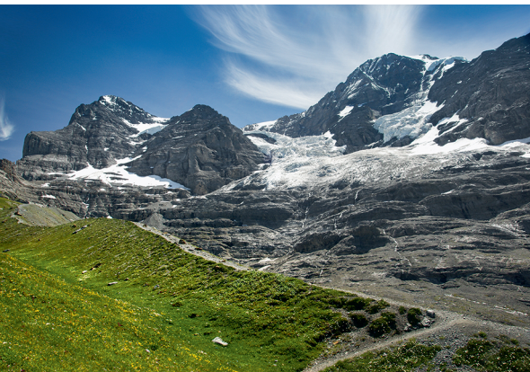
Il sentiero da Haaregg al ghiacciaio dell'Eiger si inerpica lungo la vistosa morena.

Hotel Bellevue des Alpes, Kleine Scheidegg, 033 855 12 12, www.scheidegg-hotels.ch