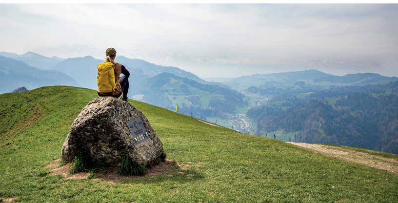
Par beau temps, on aperçoit les Alpes glaronnaises depuis le sommet du Hörnli.

Berggasthaus Hörnli (avec location de trottinettes), 055 245 12 02, www.berggasthaus-hoernli.ch Gasthaus Sternen, 052 386 14 02,