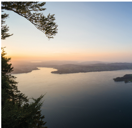
Friedliche Stimmung über dem Vierwaldstättersee.