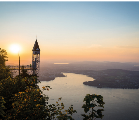
Die Aussicht vom Bürgenstock ist zu jeder Tageszeit überwältigend.

Bergrestaurant Hammetschwand: 041 610 81 10