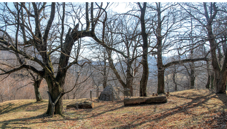
La carbonaia: dal legno del castagno veniva ricavato anche il carbone.

Ristorante Negresco, Migliegla, 091 609 12 95 Osteria-Grotto Fonti, Migliegla, 091 600 32 13