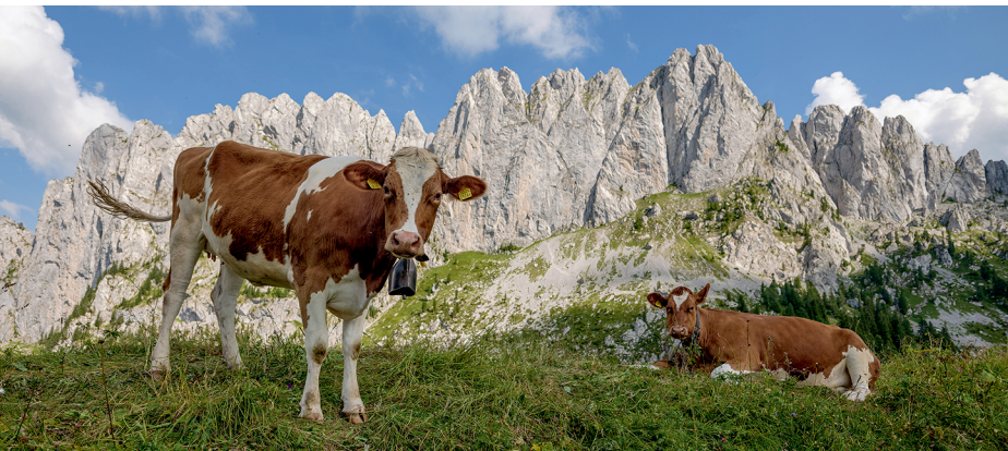
Die markanten Spitzen der Gastlosen.

Chalet du Soldat, 026 929 82 35, www.chaletdusoldat.ch Bergbeizli Chalet Grat, 026 929 81 78, www.chaletgrat.ch